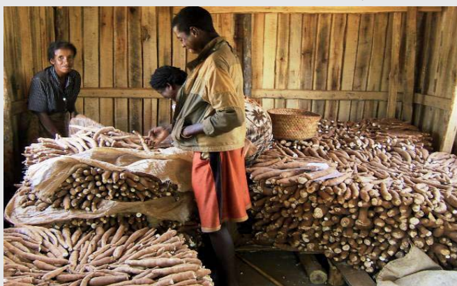
Magasin de stockage, Madagascar.

Au Sénégal, le Gret a testé en 2010-2011 la mise en place d'un crédit warrantage dans deux villages du bassin arachidier. Le test a été réalisé en partenariat avec une OP, l'Association des agriculteurs de la région de Kaolack (Adak), et avec l'IMF U-IMCEC. Le dispositif présente des intérêts pour les producteurs (accès à des services financiers, possibilité d'augmenter les gains par spéculation sur la hausse des prix, amélioration de la qualité du stockage, de la transparence des prix, et possibilité de vente collective) et pour l'IMF (nouvelle clientèle, minimisation du risque par la garantie du stock physique). Il a permis d'approvisionner des entreprises de transformation à un meilleur prix que celui du marché local. Mais ses principales contraintes restent la technicité nécessaire (qualité du produit mis en stock pour éviter la dégradation, conditions de stockage, contrôle régulier) et bien sûr il n'est rentable que si les prix augmentent entre la récolte et la soudure, ce qui n'est pas toujours le cas.