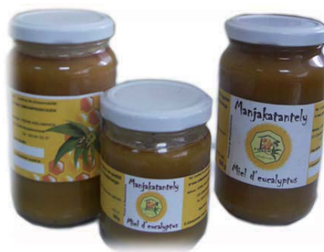
Pots de miel d'Eucalyptus, Madagascar

En faisant le parallèle avec la structuration des agriculteurs, on peut mesurer l'intérêt de ce processus dans l'évolution des programmes de développement agricole et des politiques publiques. L'existence d'organisations professionnelles facilite la concertation et le dialogue avec l'État, notamment dans le cadre de l'élaboration de la réforme de l'environnement des affaires et des politiques publiques, mais facilite également la mise en place de programmes et actions en faveur des acteurs actuels et potentiels du secteur (formation professionnelle, appui/conseil, crédit...). À Madagascar, la structuration des acteurs de la filière miel a permis de faire modifier les réglementations concernant ce secteur (voir encadré n°16).