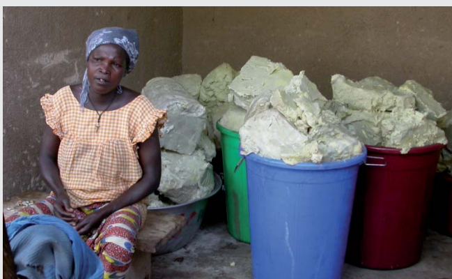
Commercialisation du karité

En zone rurale, améliorer la vente pour accroître le revenu des femmes passe par la transformation du beurre de karité (en savon par exemple) à destination des marchés locaux ruraux. Pour y parvenir, il est indispensable de renforcer les capacités des femmes des groupements au niveau de la commercialisation, de la transformation et de la gestion. Le renforcement des groupements et unions de femmes leur permet aussi d'accroître leur capacité de négociation avec les acheteurs et de bénéficier ainsi de meilleurs prix de vente de leurs produits.