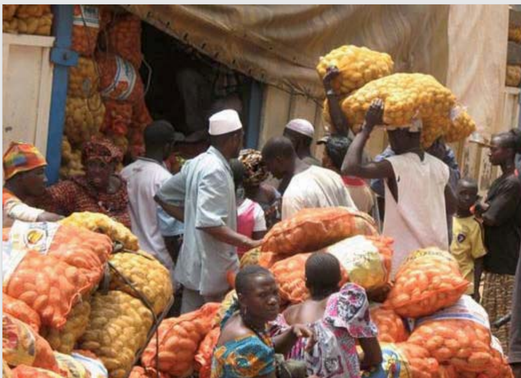
Commercialisation de la pomme de terre

La création de la FPF est liée à la nécessité de disposer d'une structure forte pour négocier collectivement avec les autres acteurs de la filière. En effet, en 1992, la fédération doit faire face à une interdiction temporaire des importations de pomme de terre et doit s'organiser pour vendre la production de ses membres à Conakry à un prix rémunérateur. La FPF a joué un rôle clé dans l'organisation de la commercialisation de la pomme de terre en regroupant la production de quatre groupements dans un seul magasin appartenant à l'UGTM à Timbi Madina et en négociant des accords avec les commerçants locaux pour écouler la production (irriguée) de saison sèche.