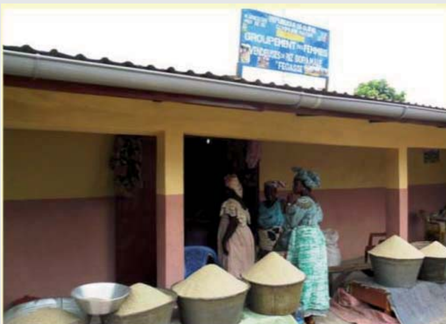
Espace de vente du riz Bora Malé à Conakry

Par ailleurs, un accent a été mis sur la concertation entre les acteurs pour, entre autres, susciter la mise en place d'accords interprofessionnels entre étuveuses et producteurs, étuveuses et décortiqueurs par exemple et la création d'une marque collective riz de mangrove portée par une organisation interprofessionnelle.