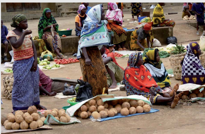
Marché rural en Tanzanie

La gestion des marchés est confiée à des comités de gestion dont la structure doit rester souple afin de faciliter toute évolution ultérieure. Pour les premières infrastructures mises en place, leur statut est proche de celui d'une société anonyme à responsabilité. Les comités sont gérés par des élus, assistés par une équipe technique composée de représentants de toutes les grandes catégories d'usagers du marché. Les règles de transparence et de gestion établies au départ sont scrupuleusement contrôlées par Mviwata. Les derniers marchés sont gérés par des sociétés d'économie mixte autonomes associant les autorités locales et les organisations professionnelles. Afin de renforcer l'unité d'appui de Mviwata, un système d'information sur les marchés, accessible par téléphonie mobile (Mamis), a été mis en place en 2011 ainsi qu'un dispositif permanent d'audit interne.