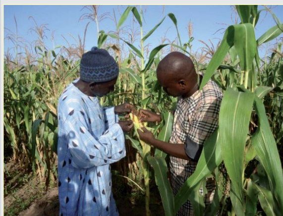
Conseil au producteur

Grâce à sa capacité de stockage, le Resopp fournit des céréales à la population rurale à des prix concurrentiels tout en offrant une bonne rémunération des producteurs. Certaines coopératives ont également fait le choix de compléter leur approvisionnement par des produits importés (maïs et riz) afin de répondre à la demande alimentaire locale.