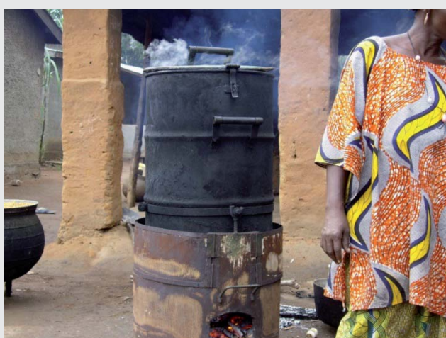
Matériel amélioré d'étuvage du riz, Guinée.

Deux projets sur lequel intervient le Gret cherchent à diffuser des machines à étuver améliorées. Elles permettent d'économiser le bois pour la cuisson, l'eau, de réduire la pénibilité, d'améliorer le rendement et la qualité. Malgré ces atouts, la faible disponibilité du matériel dans les zones rurales, son coût renchéri par celui du transport, et la nécessité de le remplacer au bout de quelques années freinent sa diffusion.