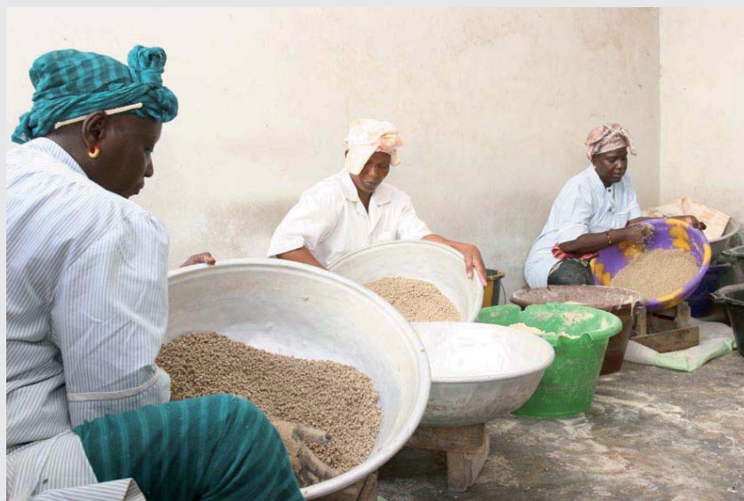
Production de couscous de mil, Dakar, Sénégal.

Le projet expérimental Infoconseil a été financé par la Coopération française et le Centre de développement de l'entreprise (CDE), une institution du Groupe des États ACP (Afrique, Caraïbes, Pacifique) et de l'Union européenne. Le projet a été mis en œuvre par le groupement Gret-Enda Graf. Il avait pour objectif de favoriser l'accès des micro et petites entreprises agroalimentaires sénégalaises à des services de conseil commercial et aux informations utiles à leur développement. Il visait à tester un mécanisme de fonds de conseil, à contribuer au développement et au renforcement de l'offre de services et à développer et gérer l'information stratégique pour un conseil de qualité.