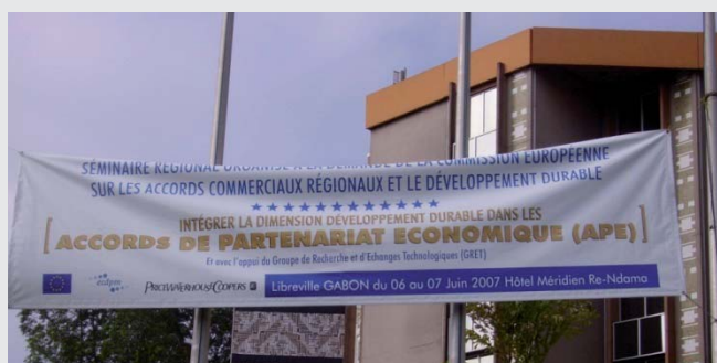
Banderole du séminaire au Gabon – juin 2007

Le Gret a aussi réalisé des études d'impacts pour les autorités africaines (Liberia en 2007, Guinée en 2005, Communauté économique et monétaire de l'Afrique centrale), systématiquement associées à des ateliers d'échanges avec les acteurs concernés et à des formations sur le sujet. Il a participé à de nombreux séminaires pour la société civile européenne ou africaine, et réalisé des études plus générales pour contribuer aux réflexions sur les marges de flexibilité dans la négociation des APE.