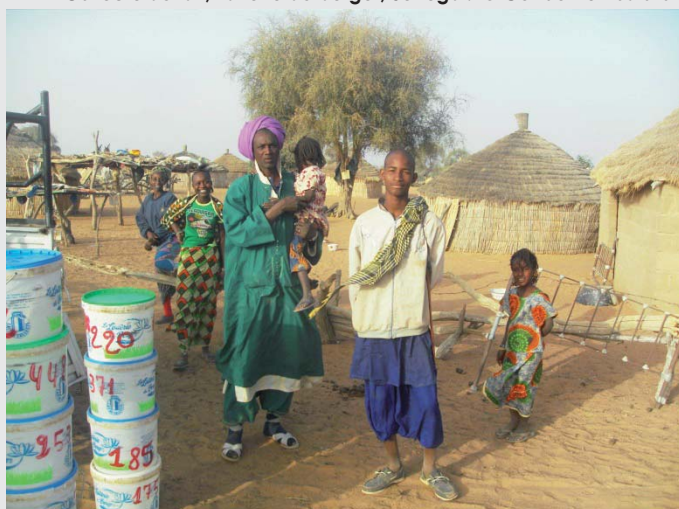
Collecte du lait, Laiterie du berger, Sénégal.